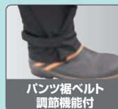
パンツ裾ベルト調節機能付